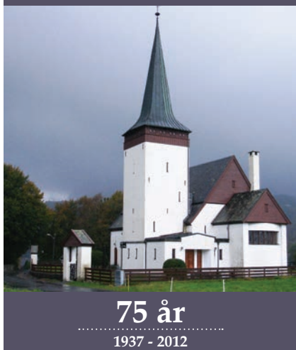
Framsida av jubileumsboka.

Vikebygd er ein gamal kyrkjestad, men har forholdsvis ny kyrkje. På to år mista bygda to kyrkjer i dramatiske brannar, henholdsvis i 1926 og 1928.